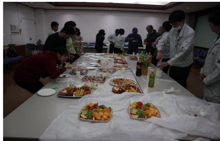
定期大会終了後は参加者全員で立食パーティー