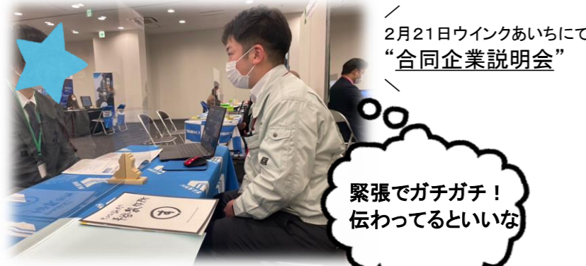
2月21日ウインクあいちにて “合同企業説明会”

2月より外部の企業説明会に参加しております。 ブースを設け、訪ねてきた方々に会社をアピールしてきました。 皆様熱心にお聞きいただき、また沢山の質問をいただきました。 企業側もとても有意義な時間となりました。