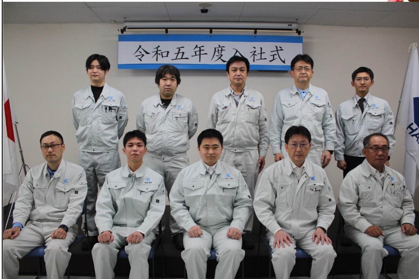
後列左から：竹○副委員長、★井副委員長、◆木取締役、今○取締役、★木書記長 前列左から：◆木委員長、★場社員、松○社員、半谷社長、清★常務