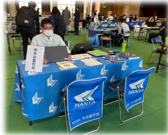
2月28日 愛知工科大学にて “学内合同 企業研究会”