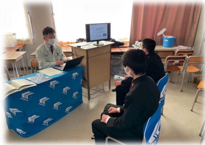
3月9日愛知県立刈谷工科大学にて “企業合同説明会”