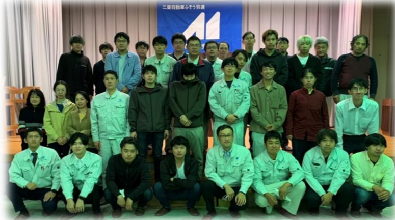
定期大会に出席していただいた方と記念撮影